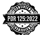
Certificazione UNI Pdr 125 Parità di Genere